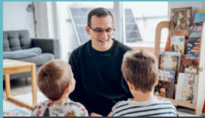
ALS FAMILIENPAPA MIT SEINEN 2 JUNGS