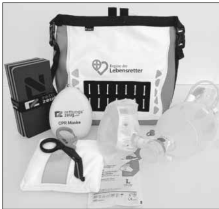
Ausstattungsset, Region der Lebensretter

Mehr Informationen zu dem Projekt „Region der Lebensretter“ finden sich auch unter www.regionderlebensretter.de .